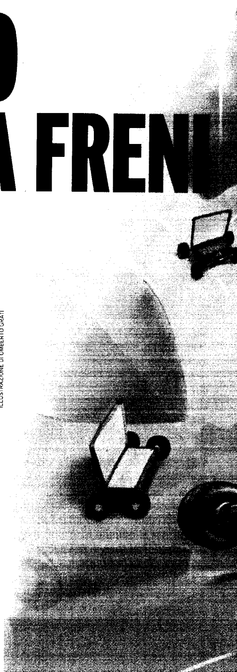
ILLUSTRAZIONE DI UMBERTO GRATTI

Già, perché quella della Rc auto sembra davvero una maledizione: nonostante diversi interventi effettuati dal governo con lo scopo dichiarato di liberalizzare il settore, i premi delle polizze non accennano a scendere. Anzi, secondo l'Isvap, l'Istituto di vigilanza sulle assicurazioni private, nel 2007 le tariffe hanno continuato a correre più dell'inflazione, almeno per alcune categorie di assicurati. A nulla dunque sono valse, almeno per ora, i cambiamenti legislativi più recenti, come l'entrata in vigore dell'indennizzo diretto, che a partire dal febbraio scorso avrebbe dovuto far scen- ▶