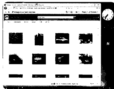
Le foto delle automobili alle quali si è interessati possono essere cercate su uno dei tanti database online

esempio, per Auto SuperMarket ( www.autosupermarket.it ) o, naturalmente, per Quattroruote ( www.quattroruote.it ). Quando siete riusciti a restringere la vostra ricerca, è il caso di cercare più a fondo presso i concessionari più vicini a voi, che spesso mettono le migliori occasioni proprio online, sulle riviste di inserzioni gratuite. Per fortuna la maggior parte di questi siti hanno filtri per la ricerca molto efficaci, che vi permettono di restringere il campo. Dal momento che siete sul web, perché non dare una occhiata anche all'assicurazione, per vedere se è possibile risparmiare qualcosa anche lì? Il vecchio e