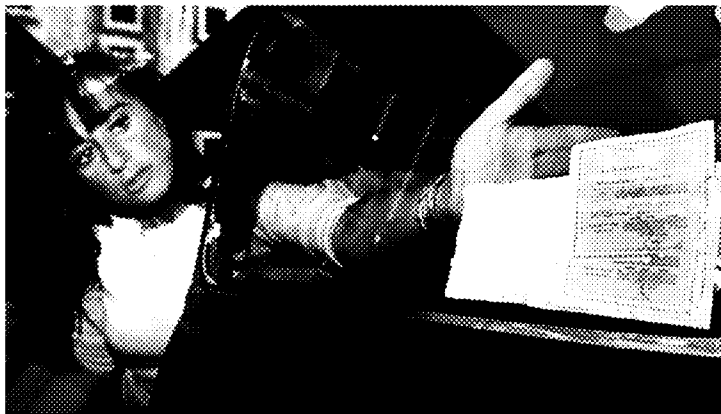
Una donna colloca la cedola dell'assicurazione sul vetro posteriore della sua auto

Gli italiani diffidano ancora delle assicurazioni online e preferiscono usare internet per il confronto delle polizze.